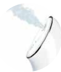
VAPOR DE AGUA