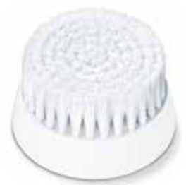
TODO TIPO DE PIEL