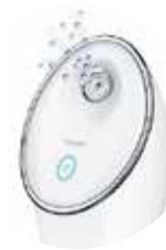
VAPOR DE IONES